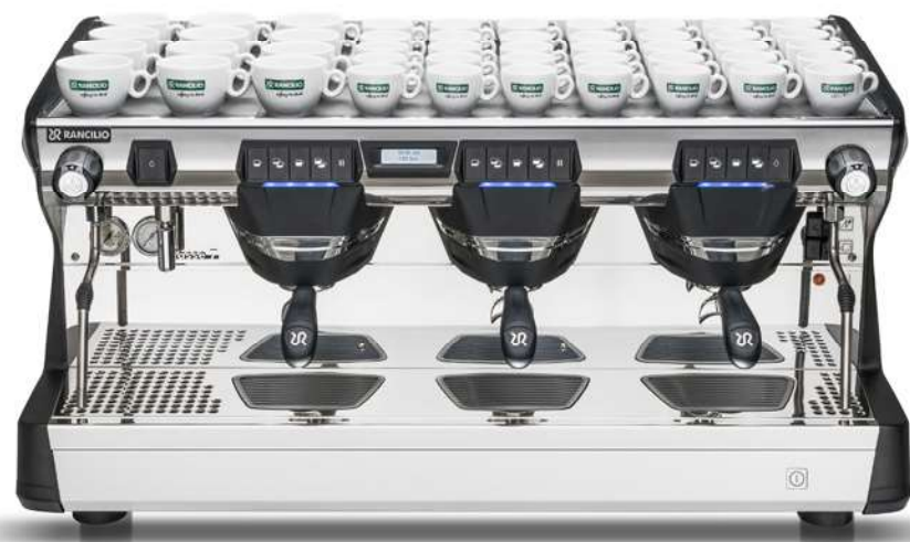
Classe 7 USB 3 gr

Most maintenance operations can be done quite simply from the front of the machine just by removing the easy to handle drip tray or front panel.