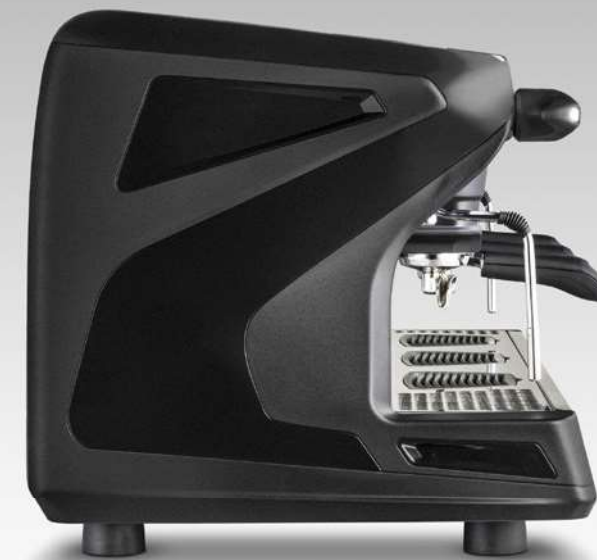
Colori / Colours: Bianco Ghiaccio/ Ice White Nero Antracite / Anthracite Black