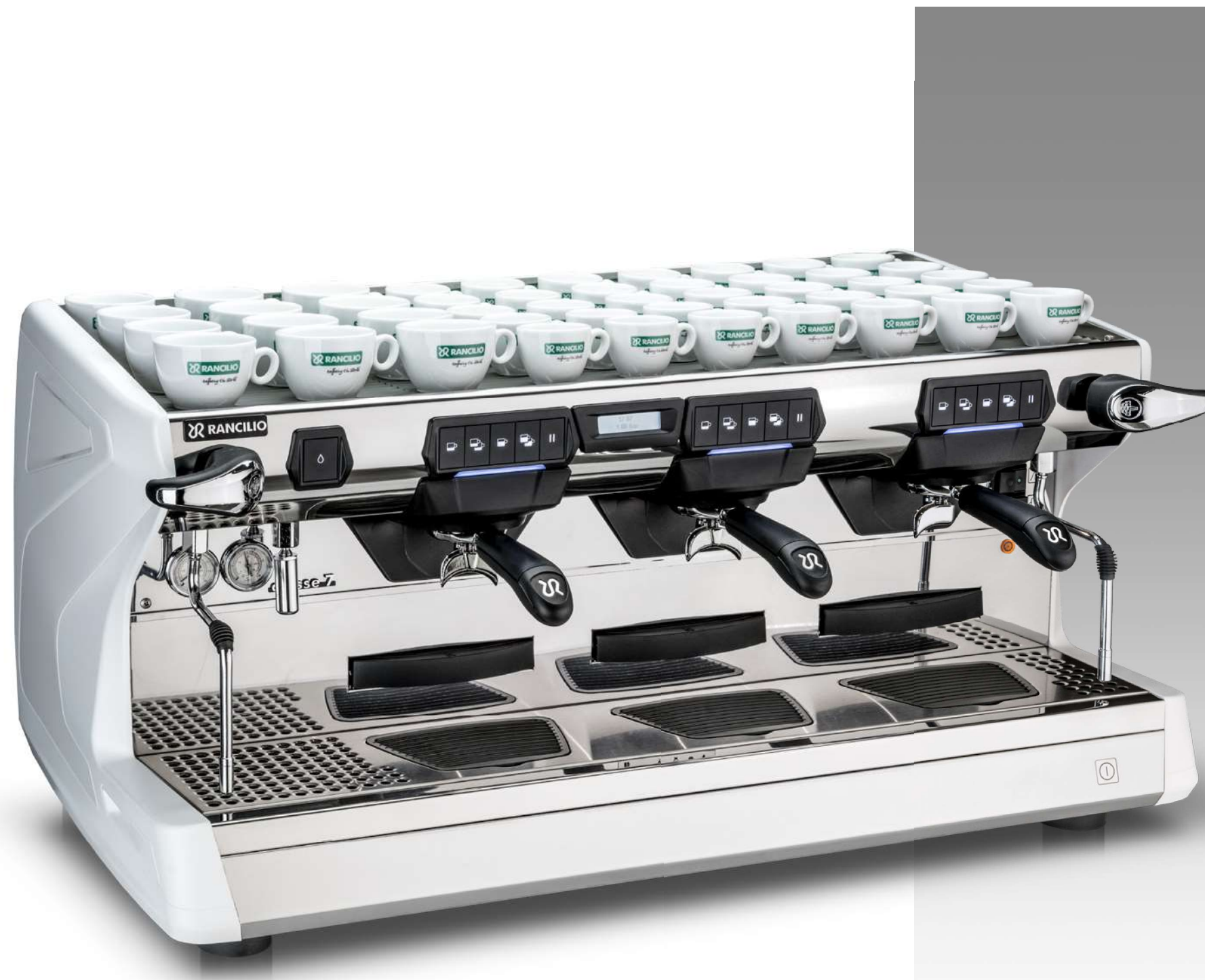
Classe 7 USB Tall 3 gr