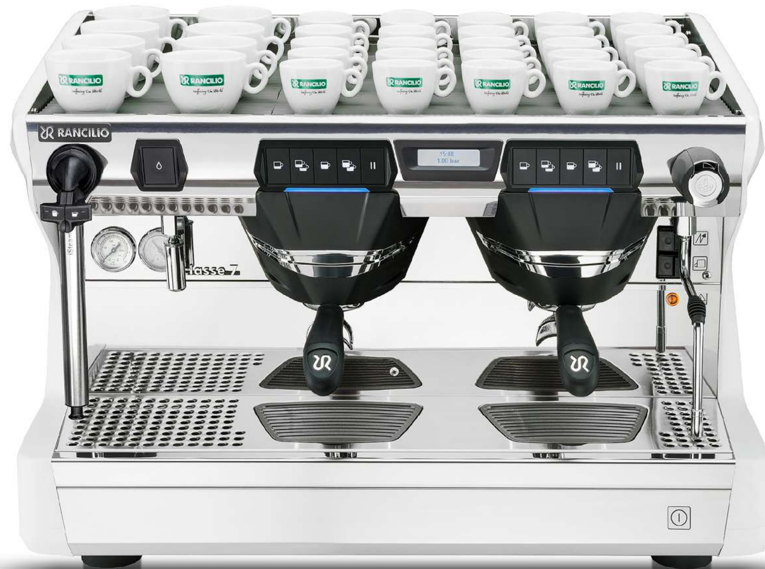
Classe 7 USB 2 gr