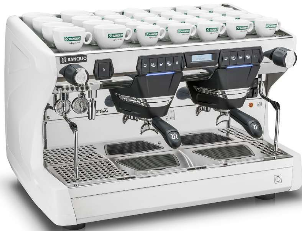
Classe 7 USB 2 gr

Top-of-the range materials such as highly polished stainless steel alongside thermoplastic composites in injection moulded ABS and nylon give Classe 7 its very own unique style.