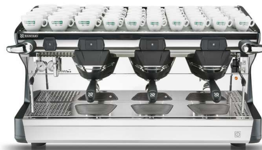
Classe 7 S 3 gr