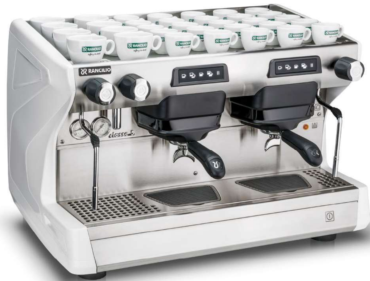
Classe 5 USB 2 gr