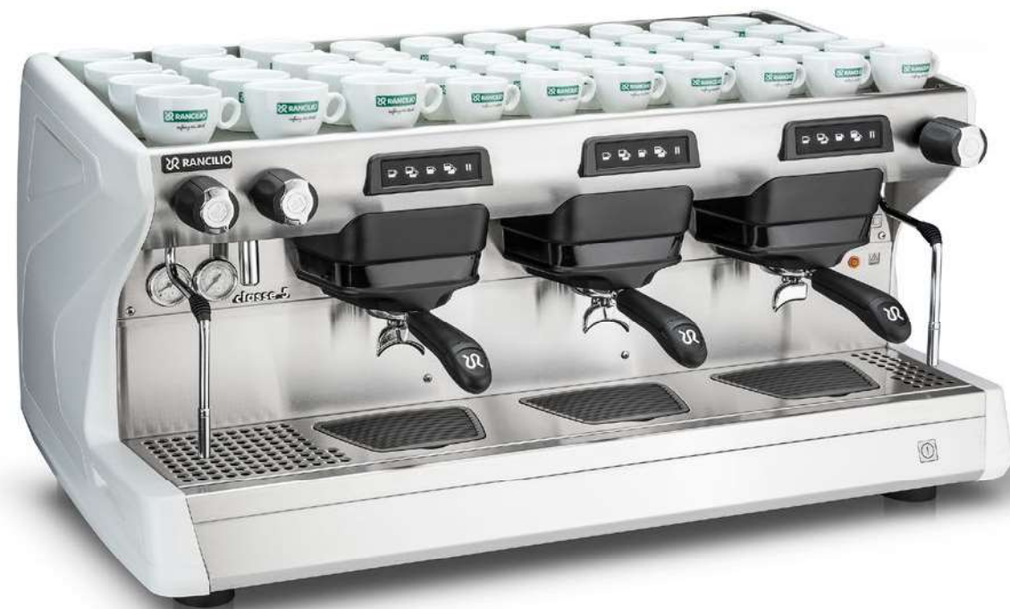
Classe 5 USB 3 gr

Fiancate moderne e ricercate, ampi coprigruppi ed ergonomia dell'area lavoro garantiscono al barista un utilizzo semplice e confortevole. La tecnologia Metal Dome applicata alla pulsantiera assicura un click-feeling armonico e gradevole.