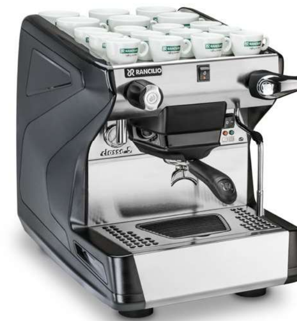
Classe 5 S 1 gr