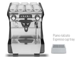
Piano rialzato Espresso cup tray