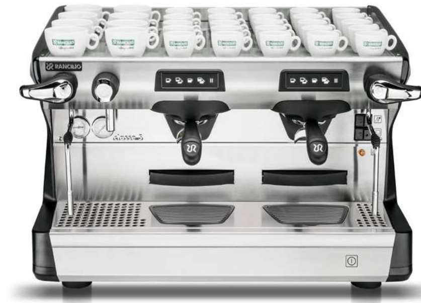
Classe 5 USB Tall 2 gr

Rancilio LAB has developed the TALL version also for this product line. Compared to the standard version, the brewing units are raised, making it possible to use glasses up to 14.5cm in height.