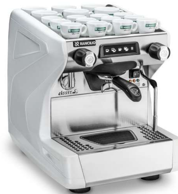
Classe 5 USB Tall 1 gr

Most maintenance operations can be done quite simply from the front of the machine just by removing the easy to handle drip tray or front panel.