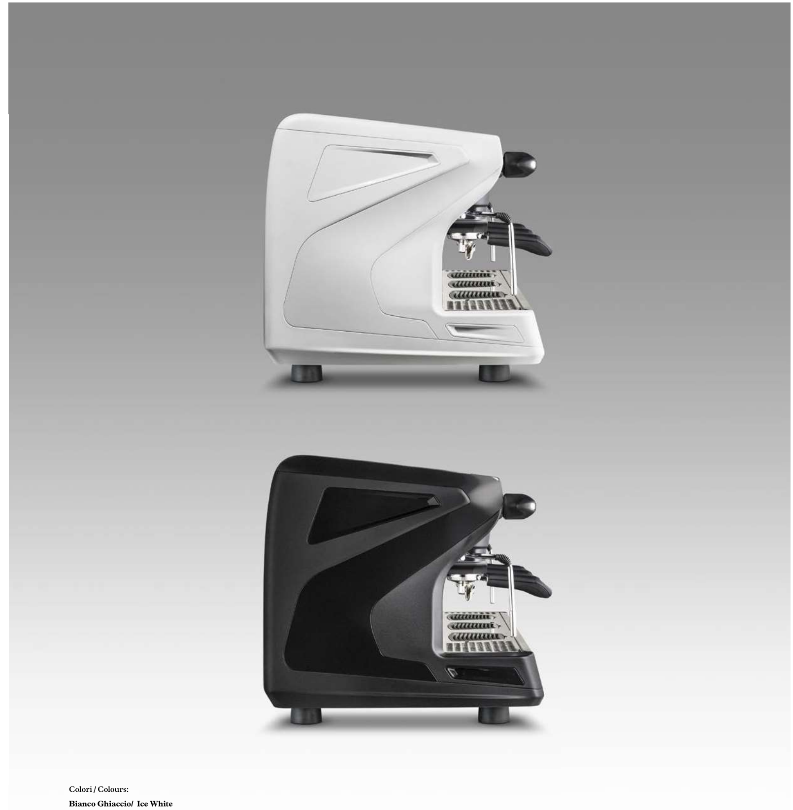
Colori / Colours: Bianco Ghiaccio/ Ice White Nero Antracite / Anthracite Black